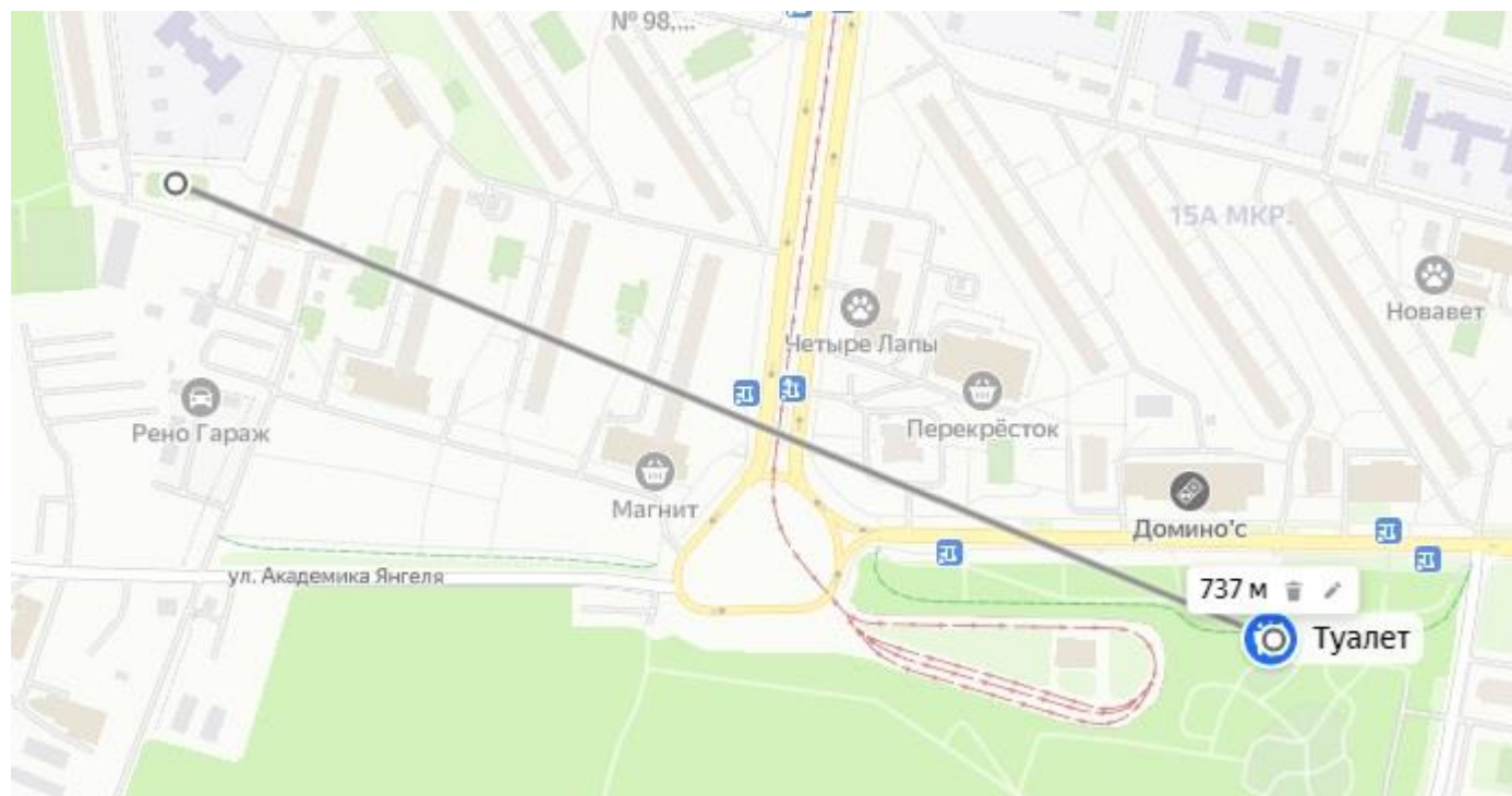
Схема прохода к ближайшему туалету: