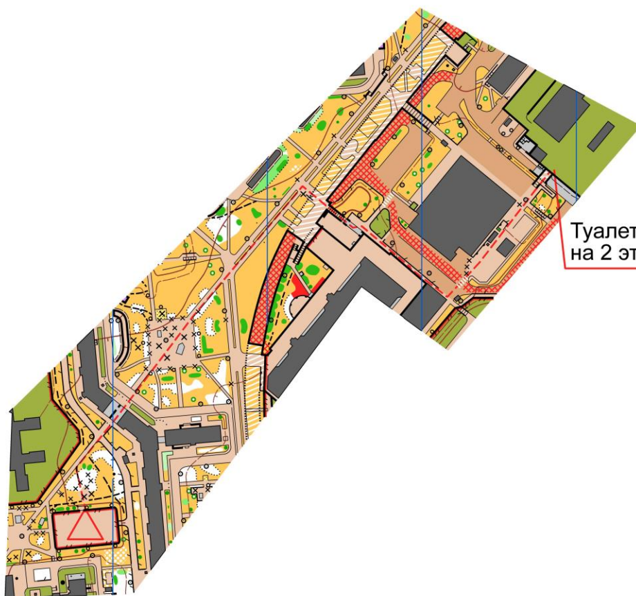
Схема прохода к ближайшему туалету: