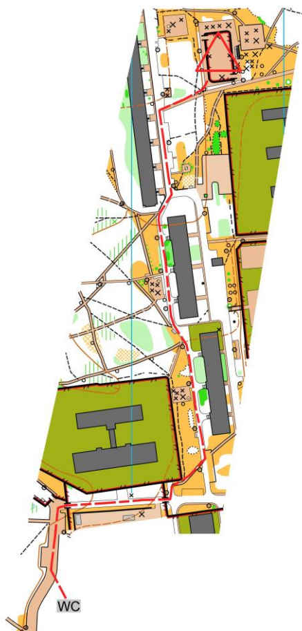
Схема прохода к ближайшему туалету.