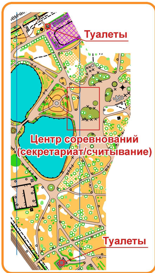
Схема расположения туалетов в парке Дубки: